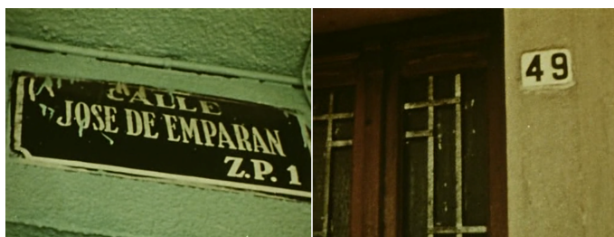
Figuras 1 e 2. Fotogramas retirados da primeira parte d’ O fundo do ar é vermelho, Mãos frágeis . Respectivamente aos 37’03” e 37’06”.

A associação das imagens da casa onde Fidel e Che se conheceram, acompanhada da leitura, na voz de Fidel, produz um testemunho que vai além do verbal, que remete à tudo que se passou naquela casa, mas também, a tudo que se passou entre os dois guerrilheiros. A imagem daquele local que não conhecemos – algo que Marker não indica claramente – se torna, com as palavras de Che, um espaço de memória que, é também, fantasmagórico (as imagens parecem ter-se desprendido levemente da realidade).