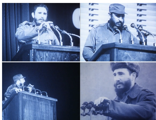
Figuras 13, 14, 15 e 16. Fotogramas retirados da segunda parte d' O fundo do ar é vermelho, Mãos cortadas . Respectivamente à 1h04'24", 1h04'28", 1h04'34" e 1h04'44".

A figura de Fidel mobiliza, neste e em outros filmes, o interesse e certo fascínio da parte de Marker. Os filmes acompanham a trajetória do líder, interessando-se por seus discursos, por sua personalidade e pelos seus gestos os mais banais. Dentre as imagens da série, há algumas retiradas de Cuba sí (Chris Marker, 1961) e outras de La bataille des dix millions (Chris Marker – SLON, 1970): o primeiro foi lançado apenas dois anos após a revolução cubana e o segundo mostra o retorno de Marker ao país dez anos depois. De um a outro, os gestos que permanecem, mas também sua variação histórica.