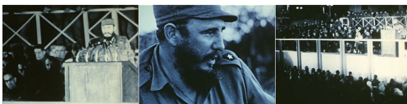
Figuras 3, 4 e 5. Fotogramas retirados da primeira parte d’ O fundo do ar é vermelho, Mãos frágeis . Respectivamente aos 39’51”, 40’17” e 41’32”.

Percebemos o caráter combativo da fala nas três situações. Esse caráter combativo se reforça pela repetição da figura de Fidel em uma série de trechos de falas do líder: ele será objeto de várias séries compostas pela montagem. Ele se apresenta não apenas pelos discursos, mas através de sua figura carismática, da oratória enfática e da repetição de gestos—fragmentários, entrecortados—e, ainda, pelo modo como performa diante de câmeras e multidões. Constrói-se dessa maneira o protagonismo de Fidel no filme.