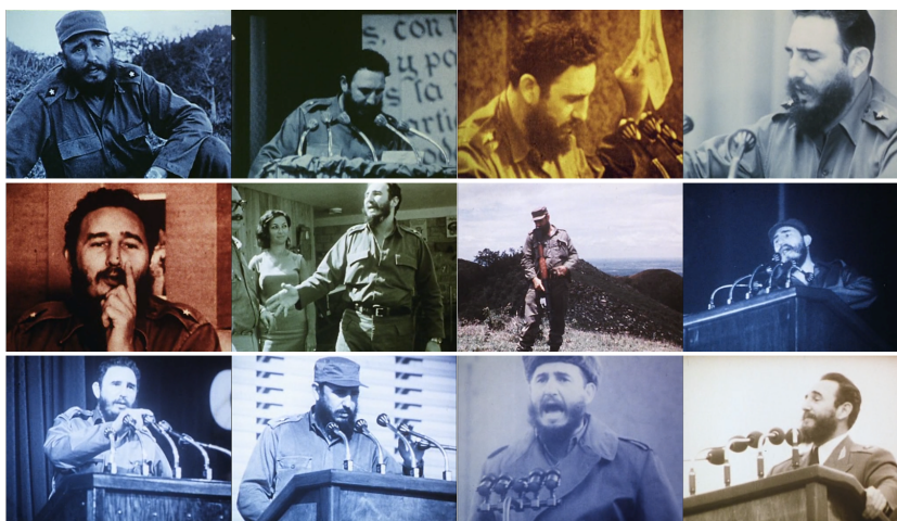
Figuras 17 a 28. Fotogramas retirados d' O fundo do ar é vermelho . 4

Ainda que várias lideranças e intelectuais sejam relevantes e recorrentes no filme, inclusive Che Guevara, nenhum deles parece ter o espaço assumido por Fidel Castro, que aparece e reaparece em momentos distintos do filme. Para além da figura carismática de Fidel, suas aparições encarnam problemáticas e impasses vividos pela luta revolucionária.