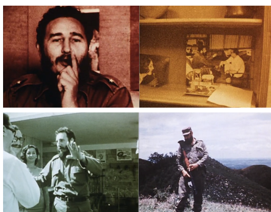
Figuras 9, 10, 11 e 12. Fotogramas retirados da segunda parte d’ O fundo do ar é vermelho, Mãos cortadas . Respectivamente à 1h03’16”, 1h03’37”, 1h04’04” e 1h04’18”.

os dedos. A narração se sobrepõe ao áudio em direto: “Aqui, Fidel ensina os segredos da cozinha italiana ao editor italiano Feltrinelli”. O entrevistado continua sua receita: “Molho bechamel, cinco camadas, carne... 30 minutos numa temperatura adequada. Quase esqueci, sobre o bechamel, o queijo!”. Todos riem ao escutar Fidel, que gesticula muito, mostrando-se desenvolto. Um corte nos devolve o plano brevíssimo de Fidel em pé, em uma montanha. Ele está em silêncio. Na mão esquerda segura um lança-granadas e na direita, um cigarro.