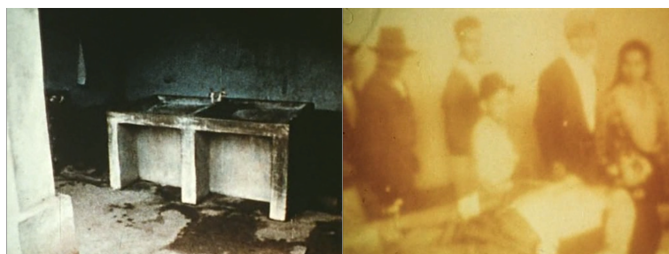
Figuras 7 e 8: Fotogramas retirados da primeira parte d' O fundo do ar é vermelho, Mãos frágeis . Respectivamente aos 45'17" e 45'20".

A câmera percorre então o local onde o corpo de Che foi exposto, agora vazio. Em corte seco, vemos, quase irreconhecível em sua precariedade, a imagem do mesmo local, agora, com o corpo de Che exposto nos tanques, deitado, sem camisa, não exatamente como em um velório, mas como um objeto de curiosidade. A primeira é uma imagem da memória, que percorre os espaços vazios nos quais a ausência parece preservar algo da presença do corpo exposto. A segunda é uma imagem testemunho, vestígio que mostra, no limite de seu arruinamento, o corpo presente, diante da fila de visitantes. A cena marca, quem sabe, o momento exato dessa passagem do luto ao mito, do momento em que o corpo morto é exposto e reúne em torno de si os visitantes, para ser em seguida tornado mito para uma multidão de jovens. Além disso, como em diversos momentos do filme, o som do sintetizador confere tom dissonante à sequência, enfatizando certo caráter fantasmático, desconcertante, para a passagem. Ela dá ritmo à montagem até o close no rosto de Che. O rosto nos aparece entre o ícone (o enigma a solicitar o engajamento do espectador) e o ídolo (imagem que solicita a identificação fusional) (Mondzain, 2013).